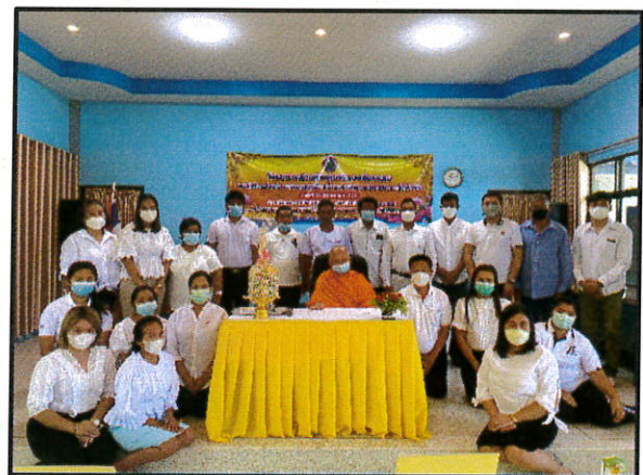
ภาพถ่ายกิจกรรม*